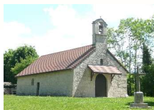
Chapelle Villard sur Ain