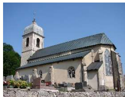
Chaux des Crotenay